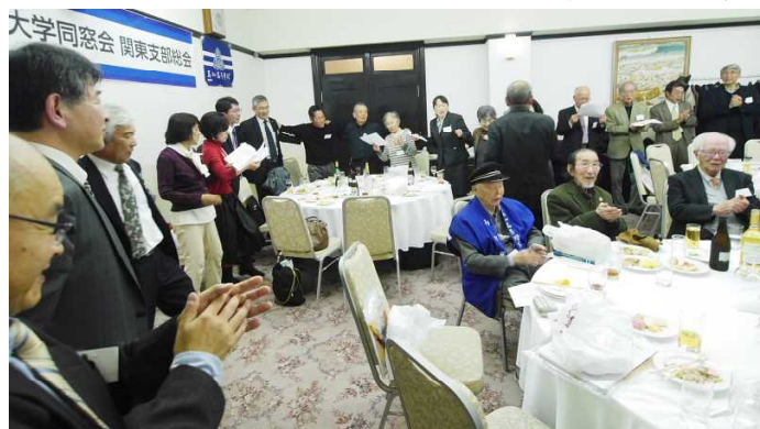
前回同窓会 (於：学士会館 2017. 11. 22)